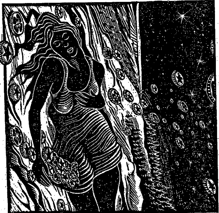
ILLUSTRATION: SAUL KOPP

Solche Vergleiche zwischen Ländern werden allerdings oft als unzulässig betrachtet, weil sich die Vorstellung von Glück zwischen verschiedenen Kulturen unterscheidet. Ämerikaner etwa seien immer genötigt, zu betonen, wie «happy» sie seien. In Frankreich hingegen gelte als dumm, Unterstühle weniger gross sind. Das Ergebnis bestätigt sich auch hier: Bezahler höherer Einkommen bezeichnen sich selbst als zufriedener als solche mit einem geringeren Einkommen. Der positive Zusammenhang zwischen Einkommen und Zufriedenheit ist für viele unterschiedliche Länder festgestellbar.