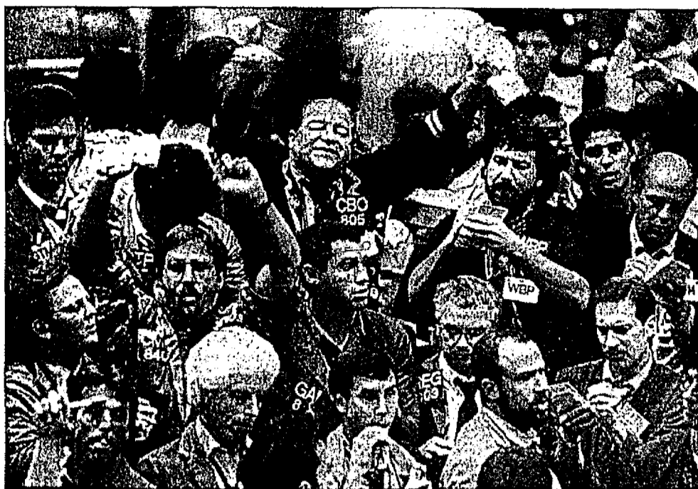
Werden Wahloptionen dereinst auch an der Börse von Chicago gehandelt?