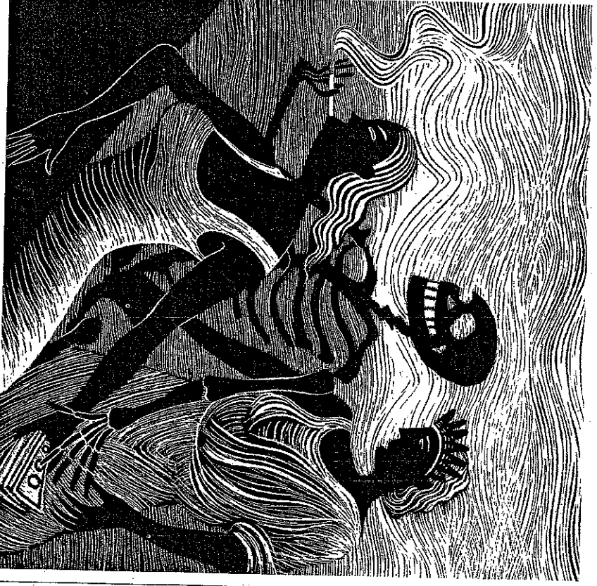
ILLUSTRATION: GABRI KOPF

Moralischen Druck auszuüben, wird ebenso häufig versucht, erweist sich aber bei den Risikogruppen als wenig wirksam. Aus einer Protesthaltung heraus können die Jugendlichen sogar vermehrt zu Zigaretten greifen. Weil Aufklärer und Moralisten kaum funktionieren, wird (allzu) häufig zu Verböten gegriffen. In Schulen, öffentlichen Gebäuden, Bahnhöfen, Restaurants und am Arbeitsplatz soll nicht mehr geraucht werden. Diese Massnahmen schützen Passivraucher und schränken in der Tat das Rauchen ein. Eine Wirkung auf die Jugendlichen ist jedoch nicht festzustellen. Damit wird die wichtigste Zielgruppe verfehlt. Ausserdem haben Verbote unschöne Nebenwirkungen. Repression ist nur wirksam, wenn die Verbote eingehalten werden. Der Staat wäre jedoch mit Kontrollmassnahmen überfordert (was wir vom Drogenkonsum her wissen) – und hat vor allem auch wichtigere Aufgaben zu erfüllen. Verbote lassen sich so leicht umgehen. Viele junge Menschen werden zudem zu Gesetzesbrechern gestempelt. Der Gegensatz zwischen den Generationen verschärft sich. All dies sollte vermieden werden. Die